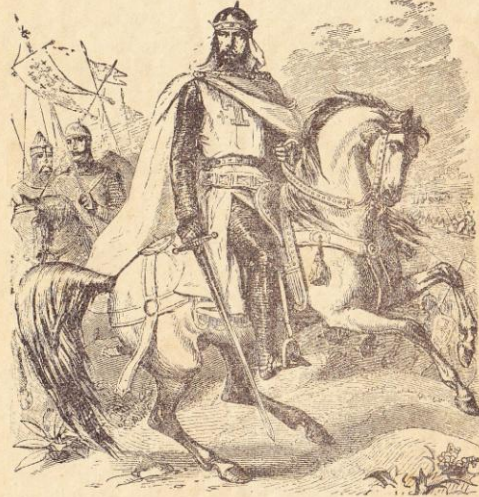
Karel de Groote reed rond om het recht te handhaven.

verteld, hoe keizer Karel rondreed om overal het recht te handhaven. Hij liet het volk onderwijzen, hij voerde het kruis voor de goeden en het zwaard voor de boezen. Nog spreekt men van